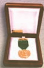
Premio Prócer "Pedro Domingo Murillo"