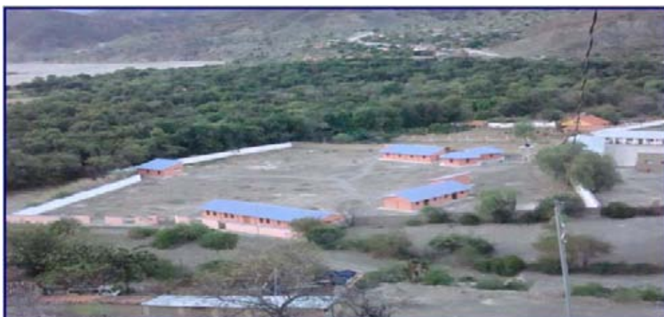
Vista panorámica del campo de aprendizaje