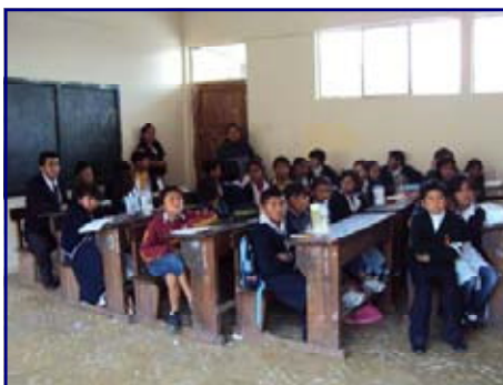
(Alumnos de la U.E. Daniel Sánchez Bustamante)

"Por primera vez salimos de la U.E. donde a través de consignas pudimos observar el paisaje, fue una experiencia inolvidable , bueno para mi fue muy sorprendente porque los niños trabajaban como si conocieran de AA. Lo alumnos se desarrollaron muy bien manejando los contenidos a través de la experiencia de la realidad".