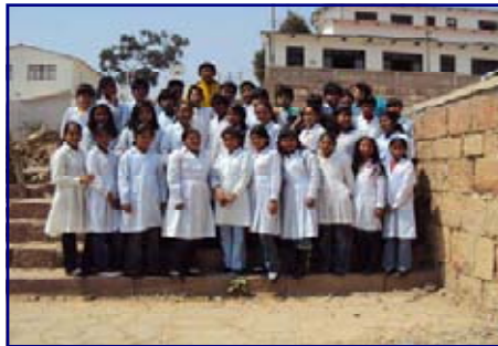
(Alumnos de la U. E. Loyola )

"Aprendimos que hay nuevas formas, de trabajar con los niños implementando las estrategias en las diferentes áreas sobre todo consolidando más el trabajo en equipo donde los niños son solidarios y respetan la opinión del resto del grupo..."